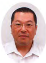
資産課税統括官 あお やぎ かず ゆき 青柳和幸 (留任)