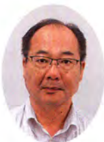
個人課税2統括官 しも だ ひろ しげ 下田弘重 (留任)