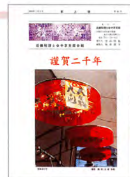
都大路 第41号 平成12年1月1日発行

それから全員参加の旅行記は十数年続きましたが、現在は形を変え、たくさんの写真とキャプションとにより、さらに旅行の楽しさを表現した旅行記を皆様にお届けしています。