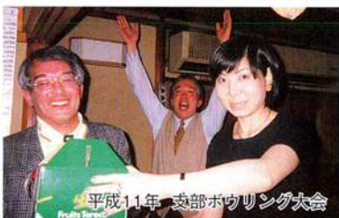
平成11年 支部ボウリング大会