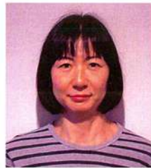
しげ たに ふみ の 野