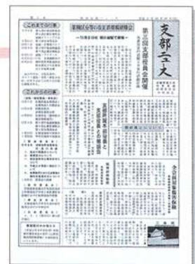
支部ニュース 第1号