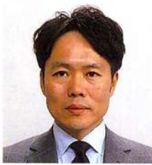
かわ ぎし のり お 夫