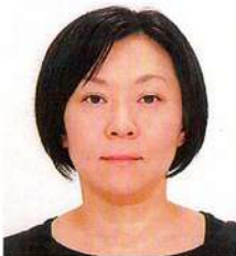
かわ ぼた たか こ 子