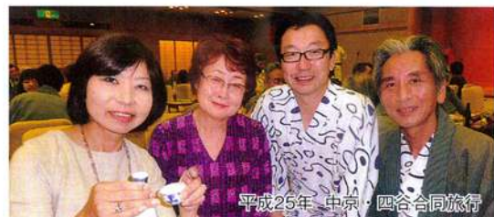
平成25年 中京・四谷合同旅行