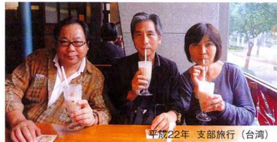
平成22年 支部旅行(台湾)

ウェアもおしゃれやったね。仕事着、正装、遊び着も常にセンスのいい新しい服やったし、シーズン毎のゴルフウェアを見るのも楽しみやったよ。