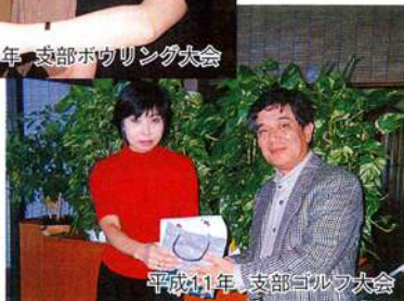
平成11年 支部ゴルフ大会