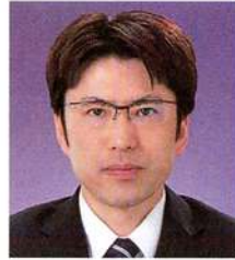
きよ ほん ゆう へい