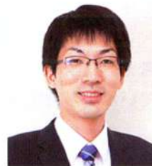
わ ち ひで ひさ 和 知 秀 永