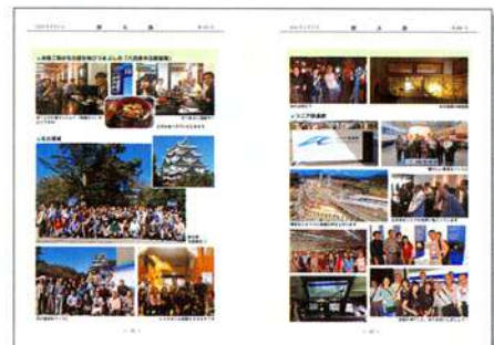
平成26年1月1日発行 第69号