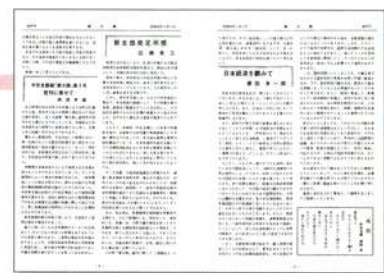
昭和56年1月1日発行 創刊号