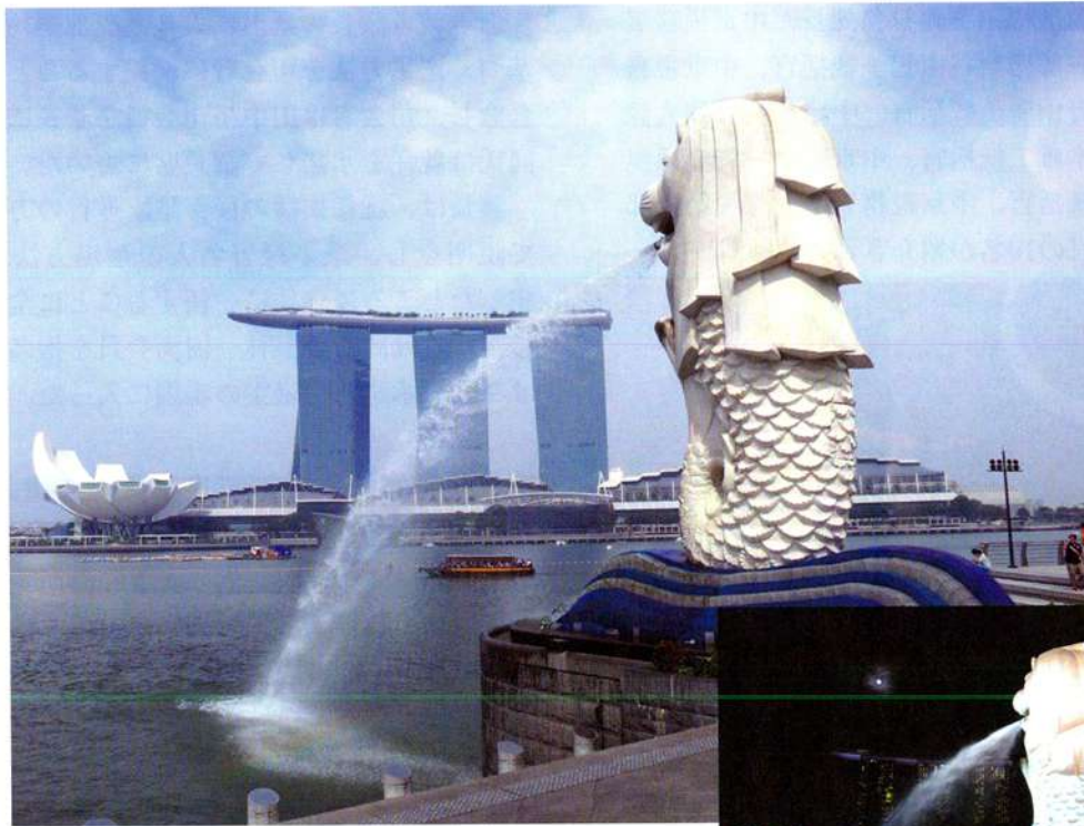
マーライオン (シンガポール)