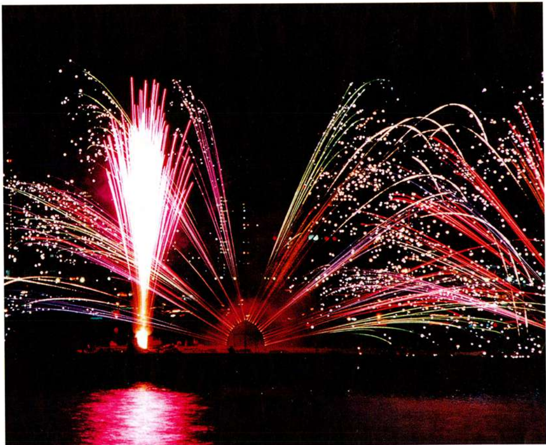
みなとこうべ海上花火大会