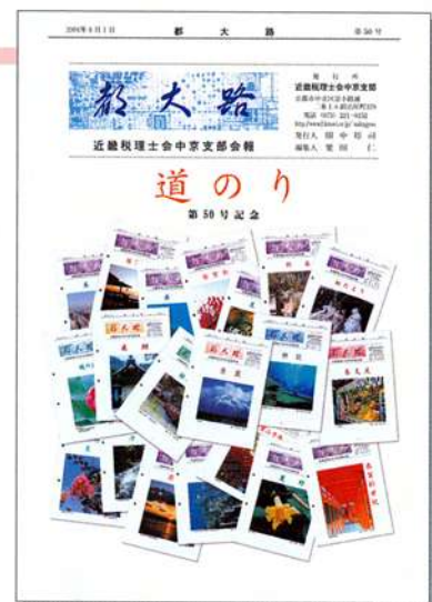
「都大路」第50号 (2004年8月1日発行)